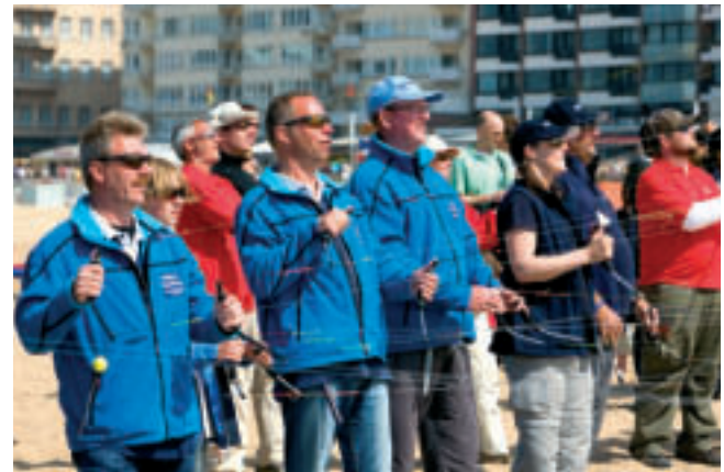
Kiters actief op het sportstrand

Vele roeiers vinden hun weg naar de Koninklijke Roei en Nautische Sport Oostende (KRNSO) en bereiden zich op het kanaal Oostende-Brugge voor op een eerstvolgende wedstrijd.