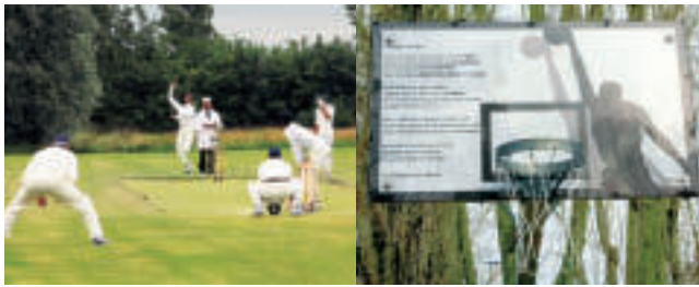
Cricket in sportpark De Schorre Sportpoëzieroute