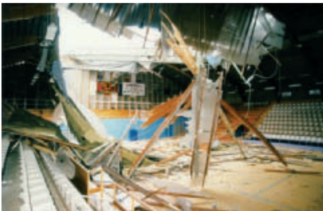
Inval werfkraan op basketbalzaal

Sportcentrum De Koninklijke Stallingen fungeerde jaar en dag als de belangrijkste overdekte sportlocatie. Dit unieke houten gebouw werd in 1902 in opdracht van koning Leopold II gerealiseerd. Paarden hebben er nooit gestaan, maar achter het historische gebouw werd een ruime polyvalente zaal en basketbalzaal gerealiseerd. De zijbeuken werden omgebouwd als trainingsplaats voor verschillende turn- en gevechtssportverenigingen. Hier kenden basketbal-