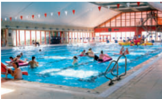
Olympisch zwembad gevuld met zeewater

Het overdekte zwembad gelegen nabij de zee en ter hoogte van de Koninklijke Gaanderijen heeft een unieke ligging. Naast een olympisch zwembad gevuld met zeewater werd de infrastructuur ook uitgebreid met een relaxatiecentrum met onder meer een hydro- en manueel massagecentrum, hydro-jet relax, solarium, sauna en stoombad. Het buitenbad met een grote ligweide is op zonnige dagen voor menig toerist een geliefde locatie.