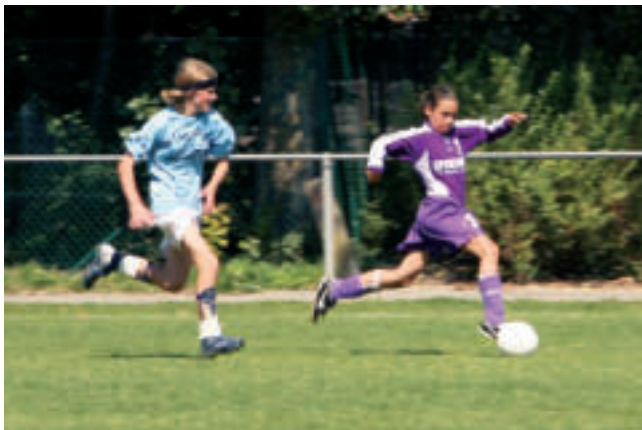
206 sportverenigingen: ook damesvoetbal

Met zijn 206 sportverenigingen is de georganiseerde sport goed vertegenwoordigd in het Oostendse sportlandschap. Hiervan doen vijftig clubs aan jeugdwerking. Basketbalclub Base Oostende, KV Oostende voetbal en Hermes Dames volleybalclub komen regelmatig in de media en spelen competitie op het hoogste niveau.