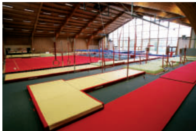
Turnsporthal in sportcentrum Mr.V-arena

De verouderde sportballon had gedurende jaren zware stormschade geleden en werd in 2000 vervangen door het architecturaal mooi ogende polyvalente sportcentrum De Spuikom, gelegen naast de surf- en watersportplas in de Vuurtorenwijk.