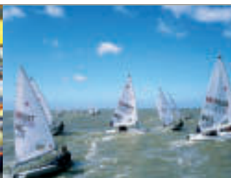
Sailing for Ostend