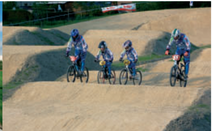
Recent aangelegde BMX-piste in sportpark De Schorre