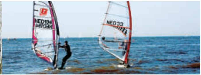
Surfers nabij het beachhouse

ten en drie verschillende hondensportverenigingen. De sociale functie wordt ingevuld door de realisatie van een uitgebreid wandelpadennet, een sportpoëzieroute, de aanwezigheid van een kinderboerderij en volkstuintjes. Specifiek voor de verenigingen ligt centraal een evenementenweide waarop grote feesttenten kunnen worden geplaatst.