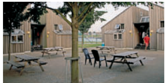
Sportchalets nabij de Spuikom

De verblijfplaatsen van het vroegere Bloso-sportcentrum Spuikom werden door het stadsbestuur gekocht en het beheer ervan werd uitgegeven aan de vzw Sportchalets Oostende. Zeven sportchalets gelegen naast de waterplas Spuikom staan ter beschikking van elke vereniging die een sportkamp, een sportstage, een sporttoernooi of uitwisseling organiseert. Er is overnachtingsmogelijkheid voor zesenvijftig personen.