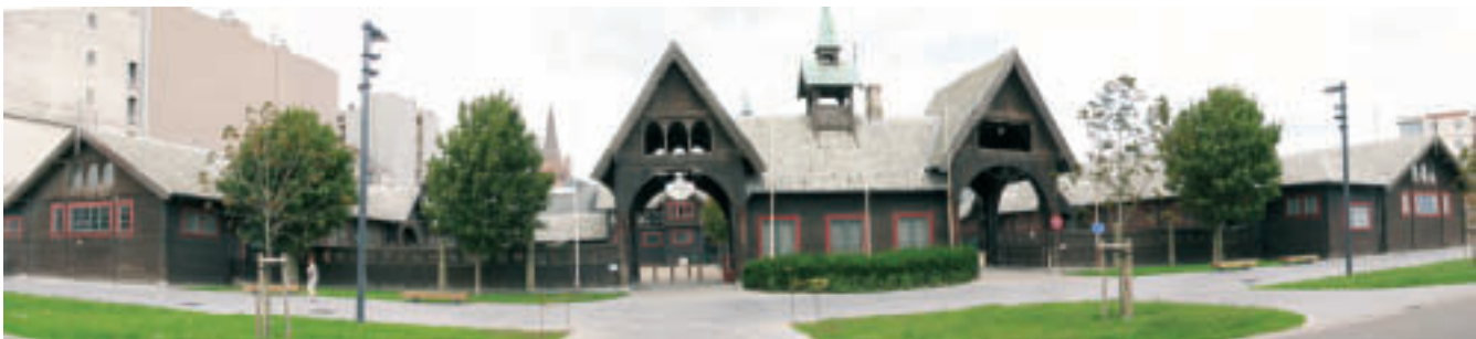
Sportcentrum De Koninklijke Stallingen

Sportcentrum De Koninklijke Stallingen fungeerde jaar en dag als de belangrijkste overdekte sportlocatie. Dit unieke houten gebouw werd in 1902 in opdracht van koning Leopold II gerealiseerd. Paarden hebben er nooit gestaan, maar achter het historische gebouw werd een ruime polyvalente zaal en basketbalzaal gerealiseerd. De zijbeuken werden omgebouwd als trainingsplaats voor verschillende turn- en gevechtssportverenigingen. Hier kenden basketbal-