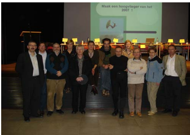
Sportraad anno 2007