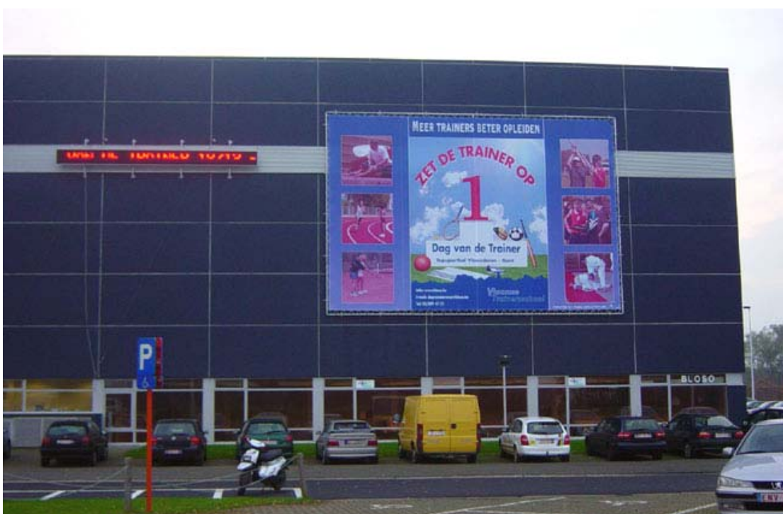
dag van de trainer 2004

5.1.3.4. Jaarlijkse evaluatie van het resultaat ten opzichte van nulmeting van verhoogde kwaliteit bij begeleiders